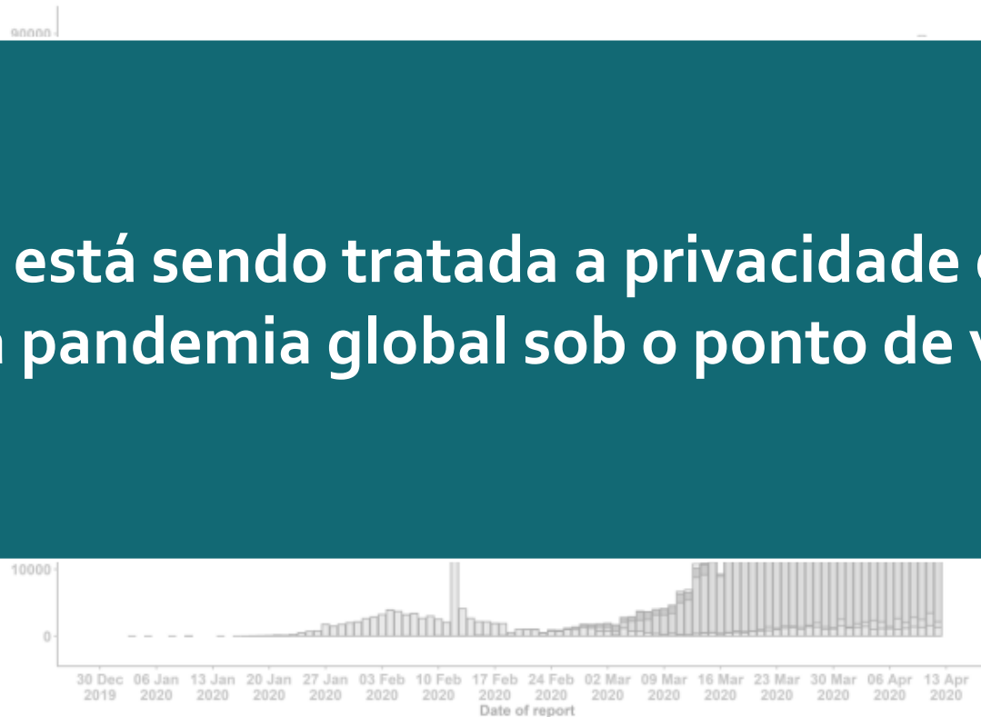
Figure 1. Epidemic curve of confirmed COVID-19, by date of report and WHO region through 13 April 2020